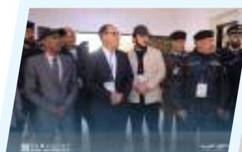
نائب رئيس لجنة الإدارة والحكم المحلي بمجلس النواب يقوم بجولة تفقدية للمراكز الانتخابية ببلدية سبها