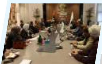
بلدية بنغازي تتابع إجراءات تنفيذ مشروع مجمع الحديد والصلب

وأكد مكتب الإعلام الأمني بوزارة الداخلية أن رئيس مفوضية الانتخابات ووكيل وزارة الداخلية أعربا عن ارتياحهما لسير عملية الاقتراع بوتيرة طبيعية منظمة، وسط تأمين كامل من الأجهزة الأمنية وبحضور أُلجان المكلفة من المفوضية ومراقبيها.