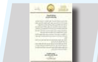
النائب الثاني يستنكر تصريحات المسؤولين اليونانيين.. ويدعو أثينا لاحترام السيادة الليبية