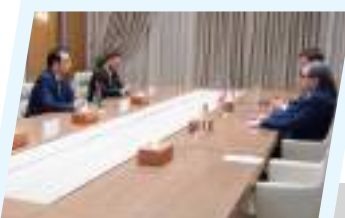
مدير صندوق الإعمار يبحث مع القائم بالأعمال الأمريكي ملفات التنمية والاستقرار