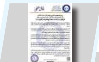
الحكومة الليبية تؤكد: ليبيا دولة ذات سيادة راسخة ولا تقبل المساس بحقوقها البحرية