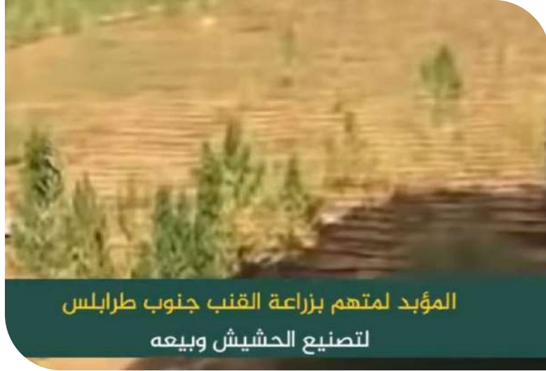
المؤبد لمتهم بزراعة القنب جنوب طرابلس لتصنيع الحشيش وبيعه

أصدرت محكمة استئناف طرابلس - دائرة الجنایات، حكماً يقضي بإدانة متهم ثبت تورطه في زراعة نبتة القنب الهندي بهدف تصنيع مخدر الحشيش والاتجار به، وذلك بإحدى المزارع الواقعة جنوبي مدينة طرابلس.