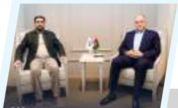
رئيس الوزراء يبحث الملفات الحقوقية والقانونية للسجناء