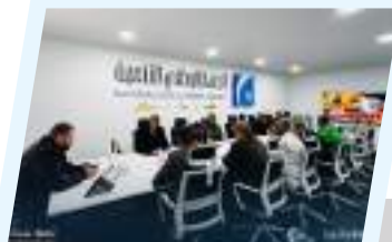
الجهاز الوطني للتنمية يبحث تعزيز الأداء ودعم الأمن الغذائي