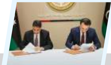
صندوق التنمية وإعادة الإعمار يرمم عقد إنشاء مقر الإدارة العامة لمصرف ليبيا المركزي في بنغازي