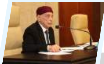
المستشار عقيلة صالح: الرقابة على دستورية القوانين ضرورة ملحة.. والانتخابات السبيل لإنهاء الانقسام