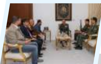
القائد العام يناقش أزمة السيولة والوقود مع رئيس الحكومة والأجهزة المختصة