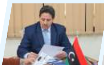
لجنة برلمانية تبحث مستجدات الشركات الوطنية المنفذة لأعمال الطوارئ