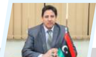
رئيس لجنة التحقق من الأموال الليبية المجددة بالخارج يرحب بالدعم الدولي لموقف ليبيا