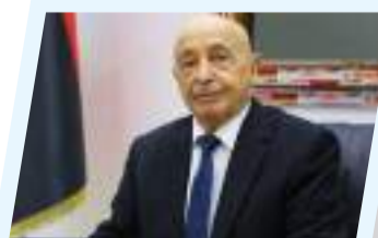
المستشار عقيلة صالح: لن نسمح بفرض أي اتفاقية بحرية على ليبيا