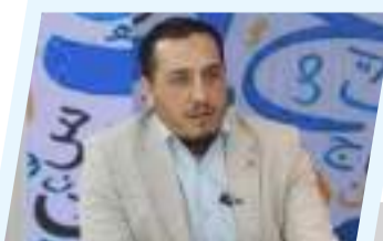
في إضافة للإعلام التتبعي.. قناة ليبيا المستقبل تطلق برنامج "إعمار"

عقد النائب الأول لرئيس مجلس النواب فوزي النويري، اجتماعاً موسعاً مع رئيس لجنة متابعة الأجهزة الرقابية زايد هدية، ورئيس لجنة الطاقة والموارد الطبيعية عيسى العريبي، لمناقشة عدد من الملفات الحيوية المتعلقة بالأداء الرقابي وقطاع الطاقة والخدمات الأساسية. وتناول الاجتماع المشكلات المتكررة التي تواجه المواطنين، وفي مقدمتها نقص الوقود وتداعياته المباشرة على الحياة اليومية والأنشطة الاقتصادية، مؤكداً أن هذه الأزمة تتكرر بصورة غير مقبولة في بلد يُعد من الدول المنتجة للنفط، ما يستدعي الانتقال من المعالجات المؤقتة إلى حلول جذرية ومستدامة. وفي هذا الإطار، بحث المجتمعون أهمية إنشاء